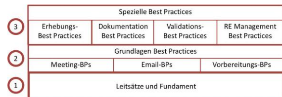
Abbildung 2: Best Practices Kategorien

Teil 3 befindet sich noch in Entwicklung. Im Folgenden gehen wir daher nur auf Teil 1 und Teil 2 ein.